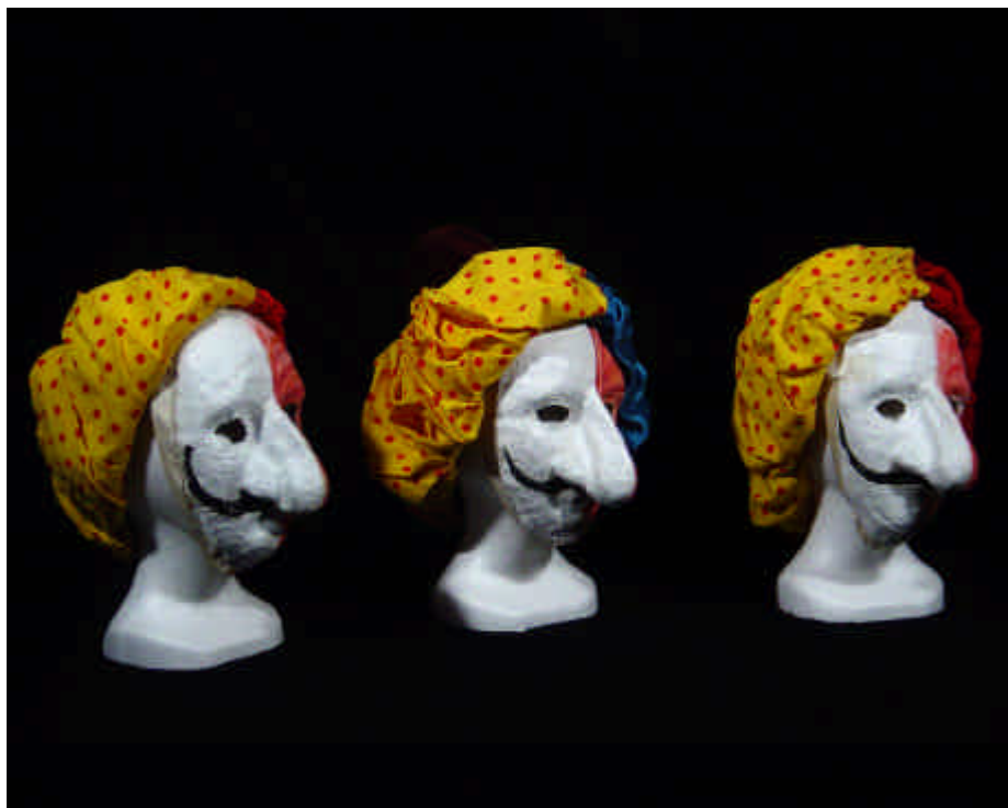
... e dopo aver bevuto